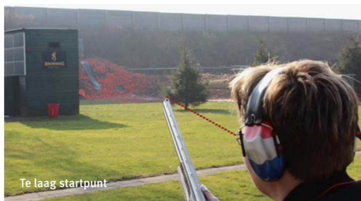
Te laag startpunt