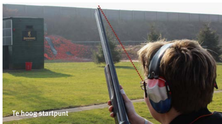
Te hoog startpunt