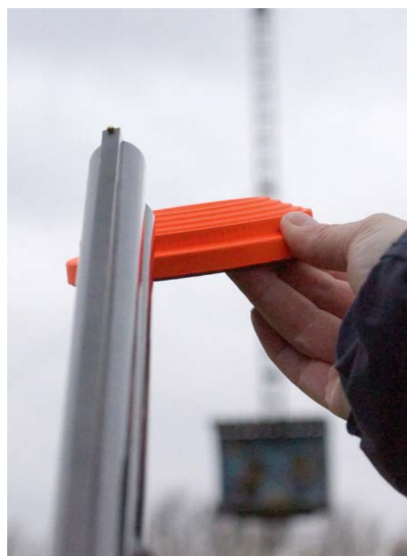
Duif inhalen en daarna de trekker overhalen