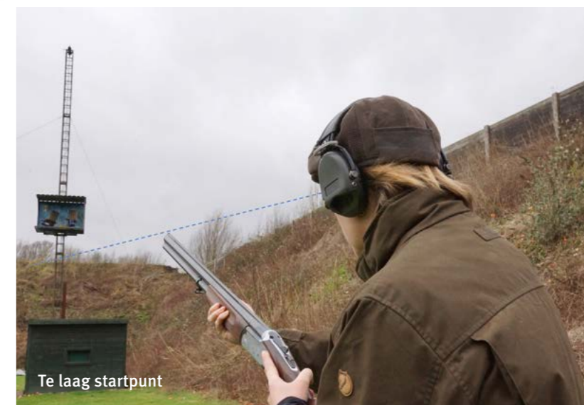
Te laag startpunt