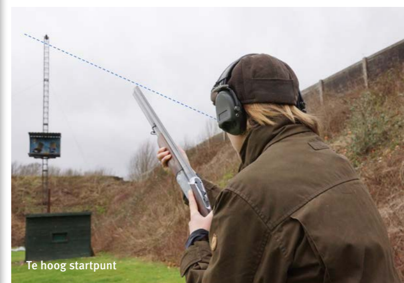
Te hoog startpunt