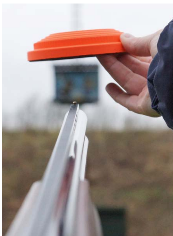
Duif laten vertrekken en achter hem aangaan

Schiettechniek inkomende duif: laten vertrekken, er achteraan, duif inhalen, net voorbij duif trekker overhalen, beweging afmaken