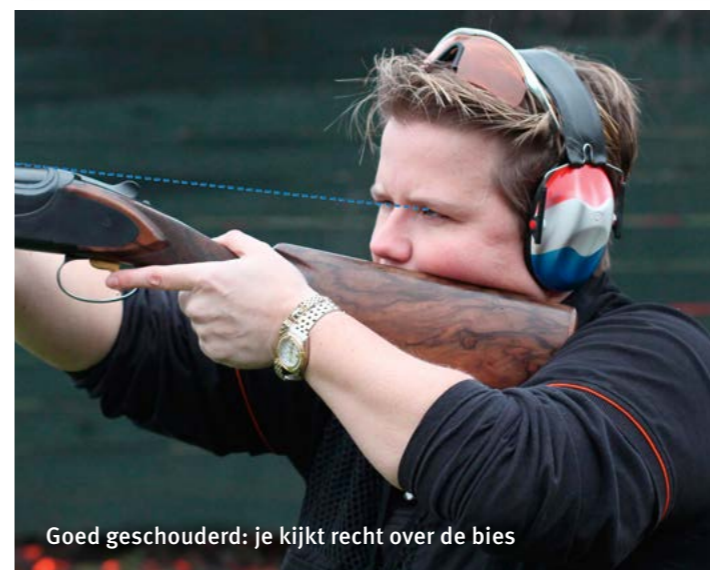
Goed geschouderd: je kijkt recht over de bies