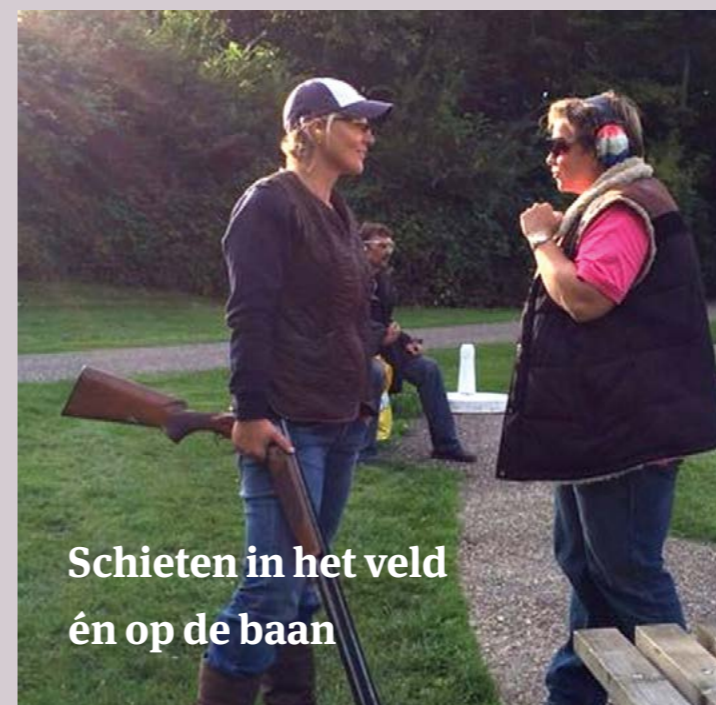
Schieten in het veld én op de baan

Heb geduld met het schieten van deze duif. Hoe eerder je de inkomende duif schiet, hoe groter de afstand die de hagel moet afleggen, dus dat betekent dat je meer voorgift moet geven. Hoe langer je wacht met het schieten van deze duif, hoe makkelijker het wordt. De duif is dichterbij en de voorgift wordt steeds kleiner.