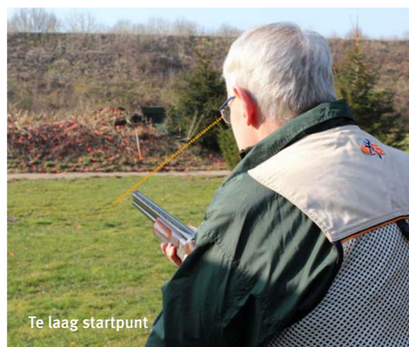
Te laag startpunt