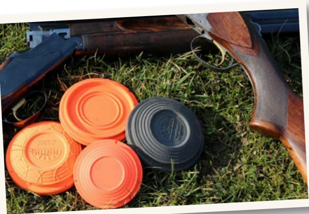
Tekst en illustratie Myrthe de Bruin

D e rabbit rolt altijd van rechts naar links. Daarbij is de rabbit anderhalve seconde zichtbaar en is de mat waarover hij rolt twintig meter lang. De afstand van de schietpost tot de mat waarover de kleiduij rolt bedraagt eveneens twintig meter. Zoals gezegd kan een rabbit ook stuiteren of 'springen'. De toelaatbare stuiterhoogte is dertig centimeter. Springt de rabbit hoger dan is het een 'no bird'. Je krijgt dan een nieuwe kleiduij.