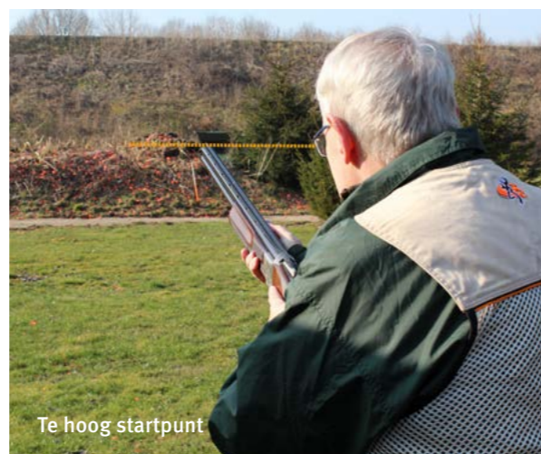
Te hoog startpunt